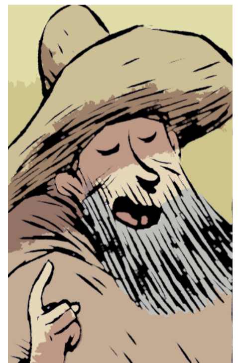
Dios se mostró muy despreocupado

A mí, al Universo, al propio Lincoln... y también, a ese insidioso hombrecillo vestido de rojo que siempre aparece por detrás cuando no estamos mirando.