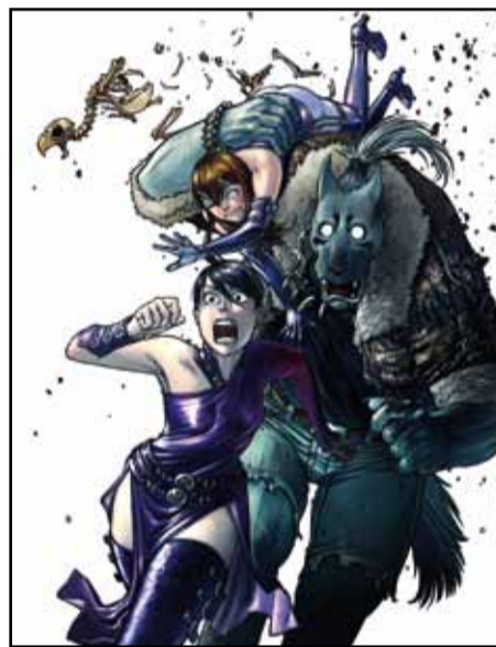
Alumnos de la FEAH en plena acción

establecimiento, exigimos la selectividad y, además, superar una prueba de acceso. Si tiene la suerte de formar parte de los afortunados elegidos, le enseñaremos