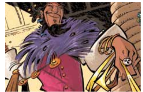
Simbad con uno de sus modelos

● Arleston y Alary. “Más barato que en el bazar y con más estilo que en las pasarelas”. La moda Simbad hace furor en la calle y entre los entendidos. Basado en unas combinaciones desenvueltas y aventureras, las innovadoras ideas que propone Simbad son un soplo de aire fresco con diseños livianos, que funcionan tanto para el día a día como para una lucha a espada.