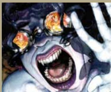
Una asistente a la exposición

El autor Rubén Pellejero dice de él: "Su dibujo en el cómic posee una fuerza remarcable y poderosa. Esas forzadas angulaciones hechas para conseguir efectividad y espectacularidad narrativa están dibujadas con los pies en el suelo y con un conocimiento pleno del dibujo de la composición y la perspectiva". Esperamos las opiniones de nuestros lectores sobre la exposición de sus "20 años entre pinceles" que este mes de septiembre hay oportunidad de ver en Avilés.