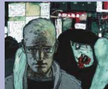
Visitantes del "Bosque de los Suicidas"