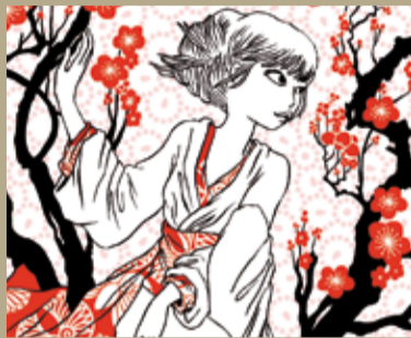
La última persona en ver al gato

Así apodado por la prensa, las últimas noticias referían sus correrías por encima de los mejores ropajes de las damas de la más alta nobleza. Personajes tan populares como Alicia del País de las Maravillas, Sherlock Holmes y varios marineros y comerciantes venidos del lejano Oriente dan fe de la locura que puede ocasionar este inocente animal, que algunos denominan "de compañía". Puede encontrar más información y toda la historia en el nuevo recopilatorio que ponemos a su disposición.