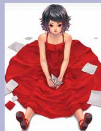
Portavoz de "TBO4JAPAN"

Hablan de una nueva luz de esperanza en el cielo de Japón: Infórmate sobre la iniciativa TBO4JAPAN.